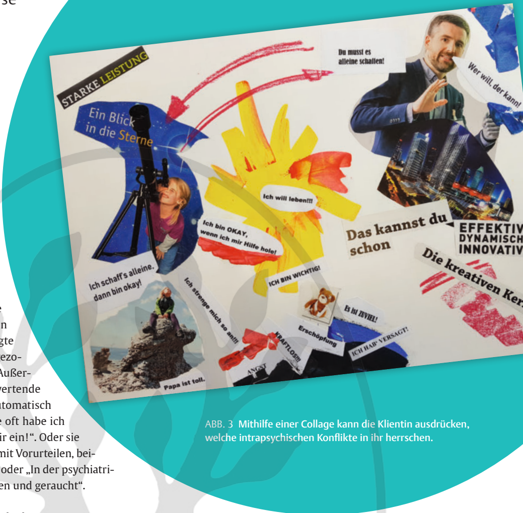
ABB. 3 Mithilfe einer Collage kann die Klientin ausdrücken, welche intrapsychischen Konflikte in ihr herrschen.

Besonnenes Erwachsenen-Ich → Das Erwachsenen-Ich ist im mittleren Kreis des Funktions-Modells platziert (☞ ABB. 2, S. 43). Als erwachsen erleben wir eine Person, wenn sie sich erst nach gründlichem Nachdenken besonnen äußert. Das wirkt fair und ausgewogen, auch getroffene Wertungen sind reflektiert und enthalten eine innere Logik. Im Gegensatz zu den anderen Ich-Zuständen ist hier weniger Gefühlsregung zu beobachten – das Erwachsenen-Ich wirkt nüchtern. Die Person sitzt aufrecht, aber entspannt, mit auf den Gesprächspartner gerichtetem und interessiertem Blick und